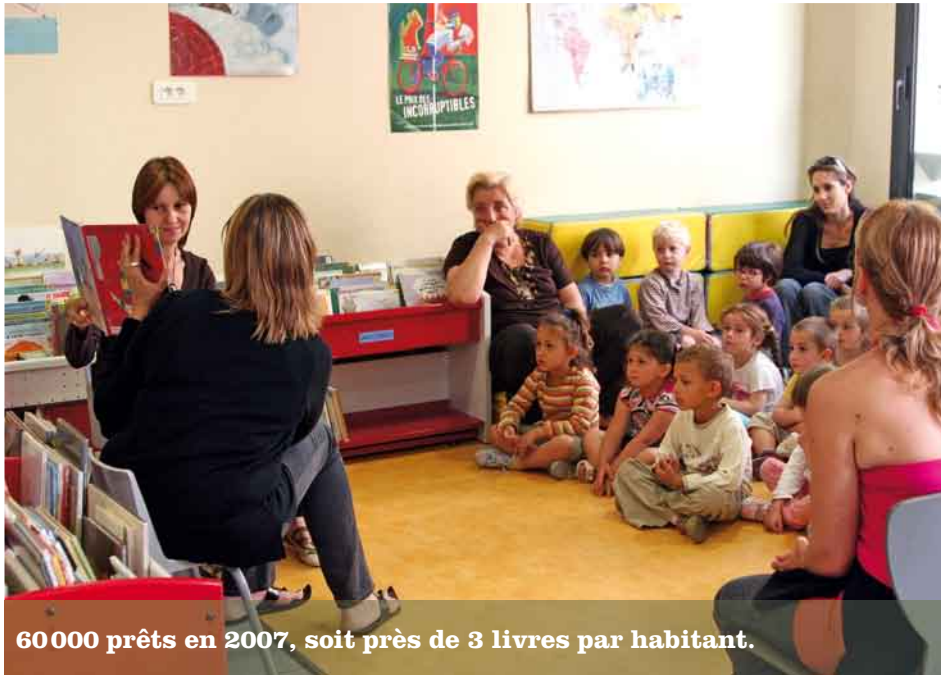
60 000 prêts en 2007, soit près de 3 livres par habitant.