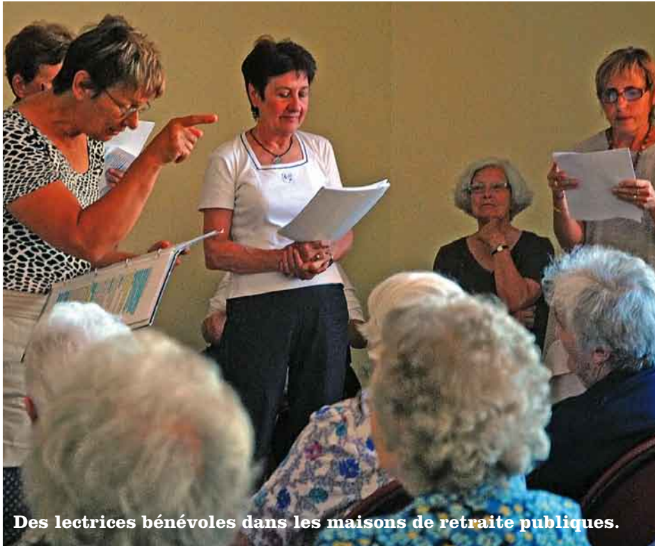
Des lectrices bénévoles dans les maisons de retraite publiques.